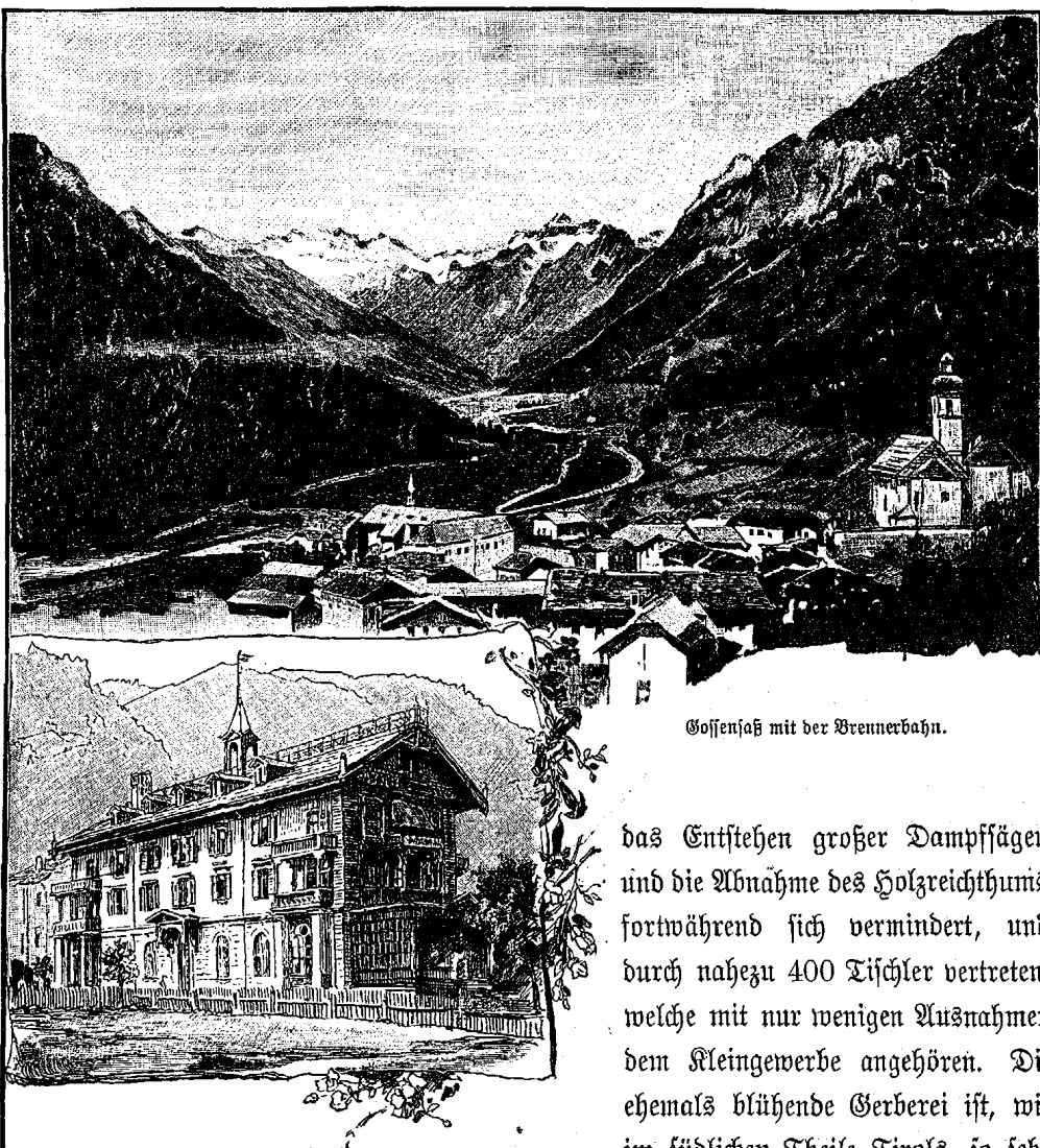
Gossensaß mit der Brennerbahn.

das Entstehen großer Dampfsägen und die Abnahme des Holzreichtums fortwährend sich vermindert, und durch nahezu 400 Tischler vertreten, welche mit nur wenigen Ausnahmen dem Kleingewerbe angehören. Die ehemals blühende Gerberei ist, wie im südlichen Theile Tirols, so sehr