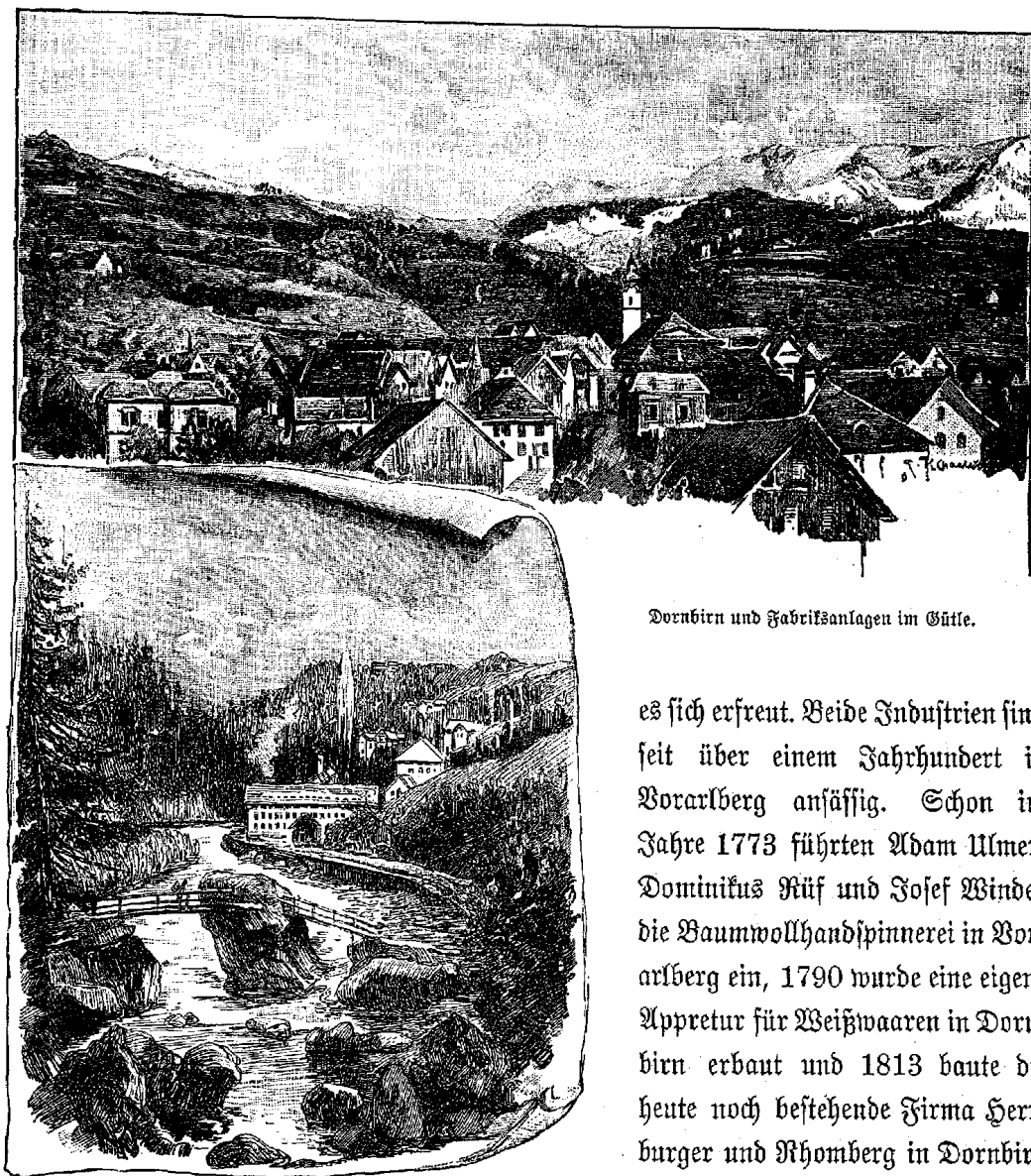
Dornbirn und Fabriksanlagen im Gütte.